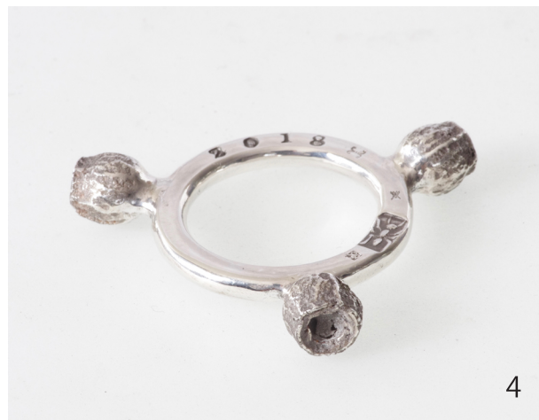
ユーカリ Eucalyptus 2018 47×38×8.5mm Silver950