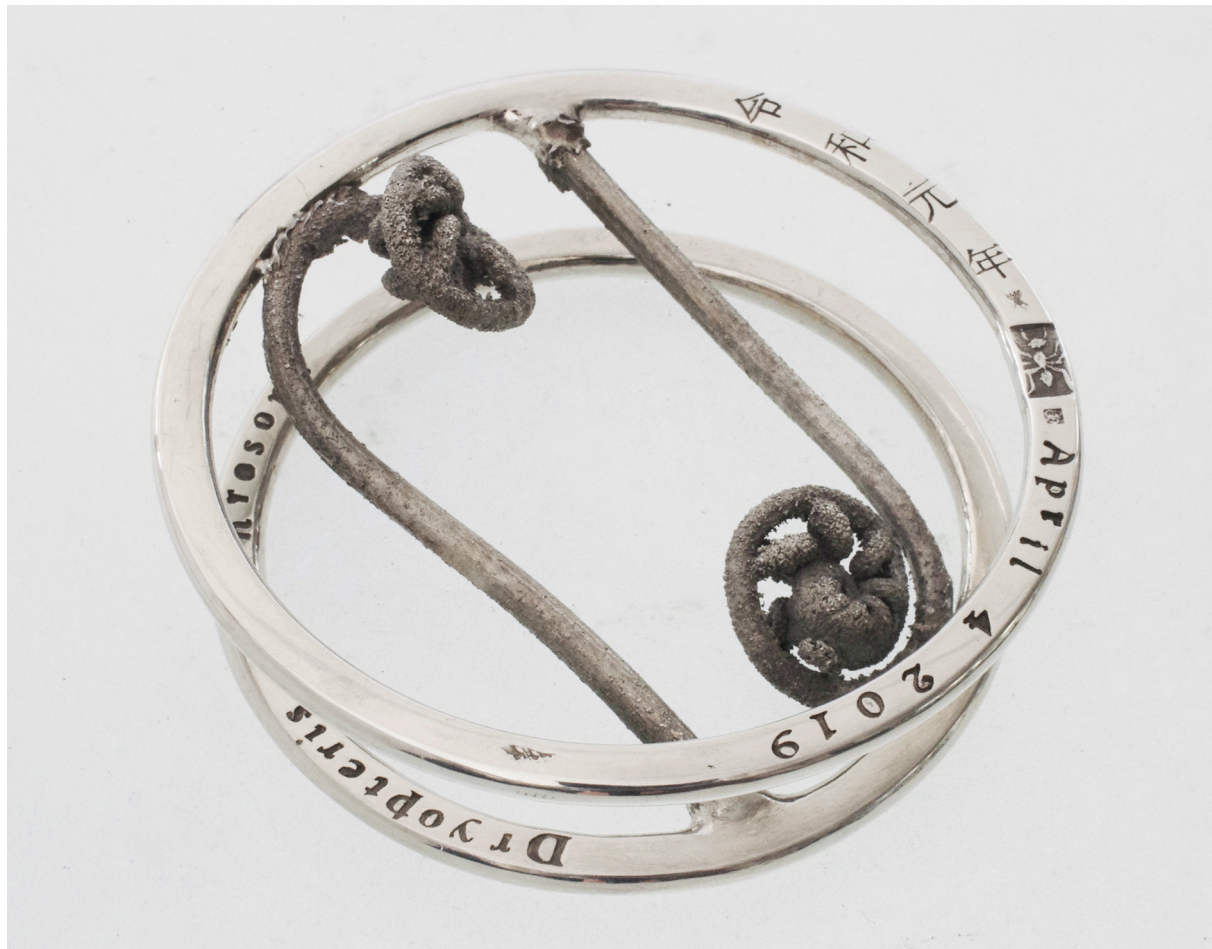
令和元年 April 4 2019 Dryopteris erythrosora 65×66×23hmm Silver950