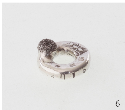
タンポポ Taraxacum officinale 2018 14×14×6.5mm Silver950