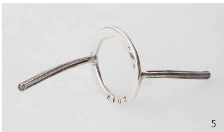
タカサゴユリ Lilium formosanum 2018 31×31×80mm Silver950