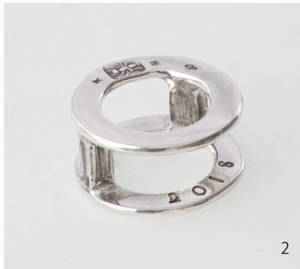
アレチハナガサ Verbena brasiliensis 2018 30×30×15mm Silver950