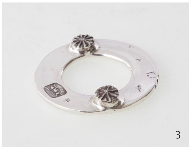
ヒナゲシ Papaver rhoeas APRIL 22 2018 39×38×6mm Silver950