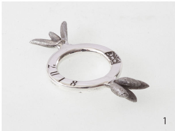
マツバギク Lampranthus spectabilis 2018 47×25×8mm Silver950