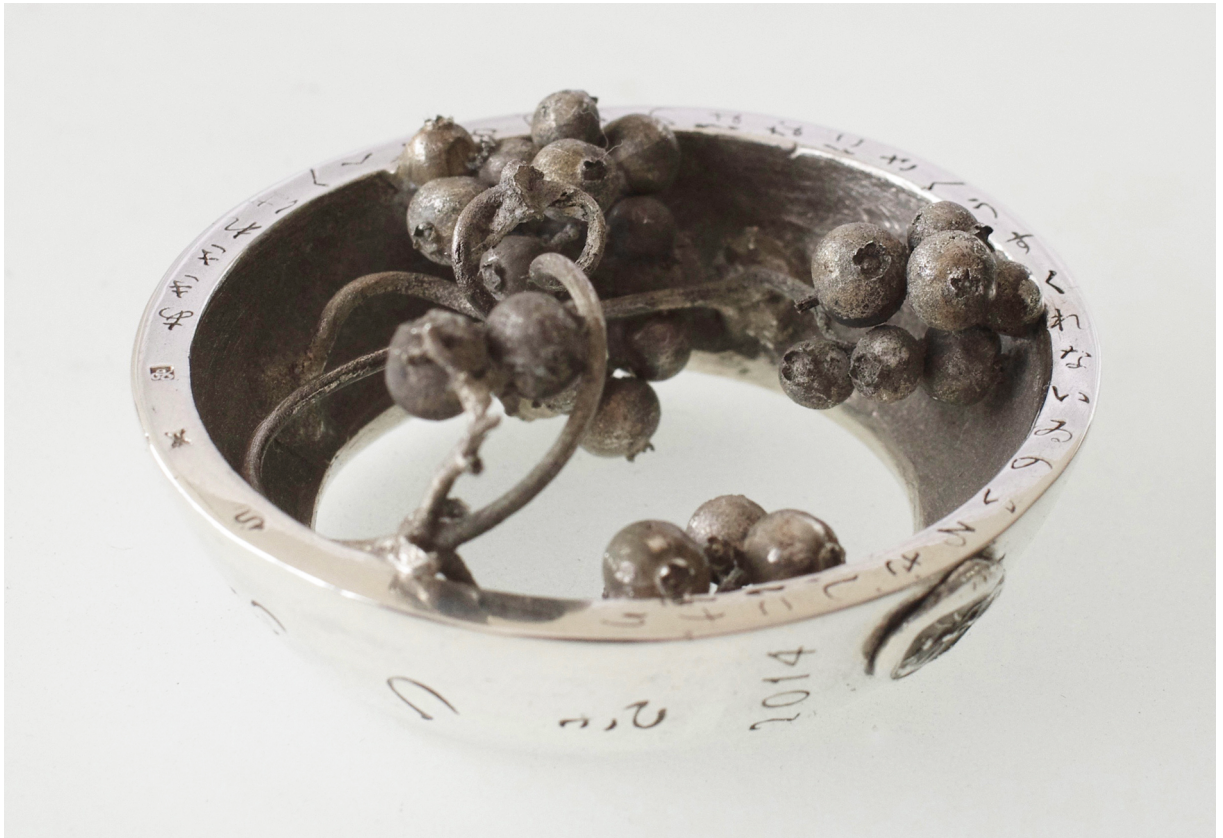
あきさればへくそかづらのはなにさへうすくれないるのいろさしにけり しもつき 2014 Paederia scandens 55×59×27hmm Silver950